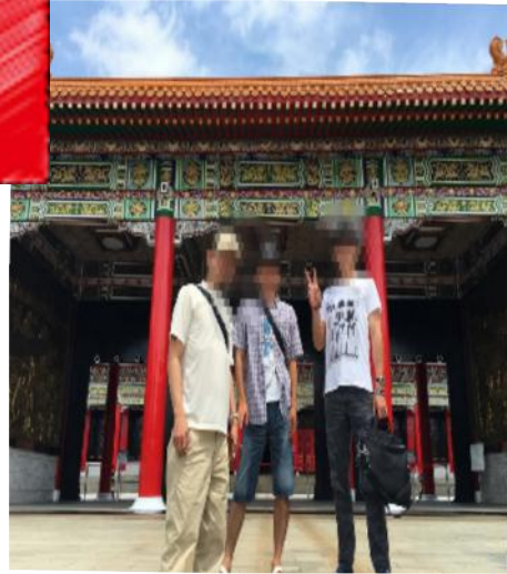
2018年4月20日～21日台北AAラウンドアップ

五月に入り、沖縄らしい暑い日が来たと思ったら、途端に突然の寒の戻りや冷たい雨の日となったり目まぐるしい気候の変化が続いております。