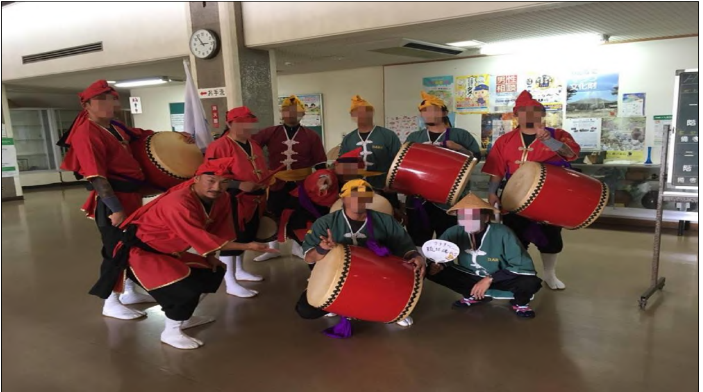
★☆☆ 25日 赤い羽根共同募金感謝の集い・南城市更生保護女性会 26日 北谷町更生保護女性会★☆☆