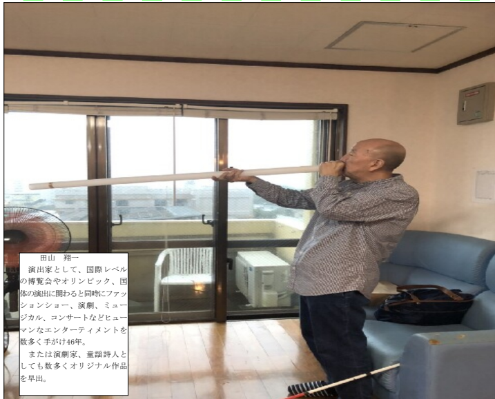
田山 翔一 演出家として、国際レベルの博覧会やオリンピック、国体の演出に関わり同時にファッションショー、演劇、ミュージカル、コンサートなど数多くのエンターテインメントを手がけ46年。 または演劇家、童謡詩人としても数多くオリジナル作品を早出。