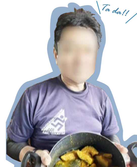
菜園で育った野菜で餃子づくり

施設に繋がって1年と10ヶ月が過ぎました。毎日のようにハウスを飛び出したい気持ちが続きながら生活している中、どうしたらストレスを貯めないで明るく楽しく生活ができるか考えた結果、酒も飲めない、タバコも吸わない、ギャンブルもできない、ストレス解消をすべて我慢して、生活しています。そこで自分が考えたストレス解消は、新しい趣味を見つけることでした。狭いハウスで、団体生活を楽しく過ごすには、ハウス農園を作って、施設の仲間にもおすそ分けをして、落ちこんでる仲間の回復につながれば、自分の回復にもなるので、ハウスの屋上で、ハウス農園を始めたのです。沖縄の農業は、台風との知恵比べなので、簡単には行きません、どんな強い風が吹いても、作物に影響が出ないように、できる限りの知恵を絞って、毎日楽しく生活ができています。毎日野菜と分かち合いながら頑張っている今日この頃です。