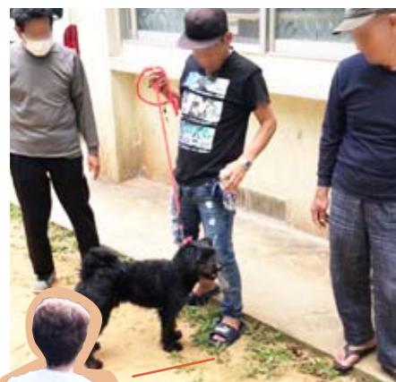
Walking the dog