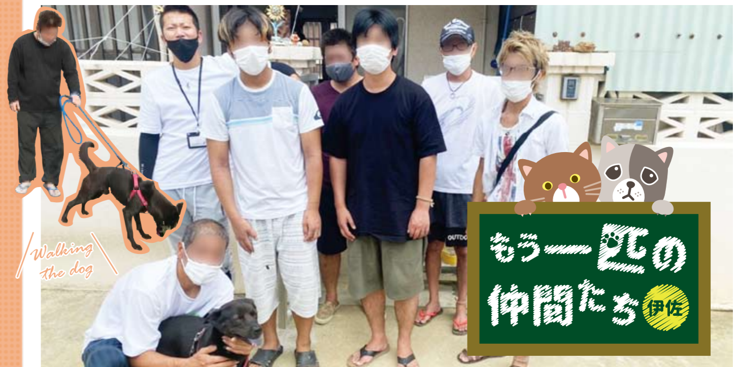
Walking the dog