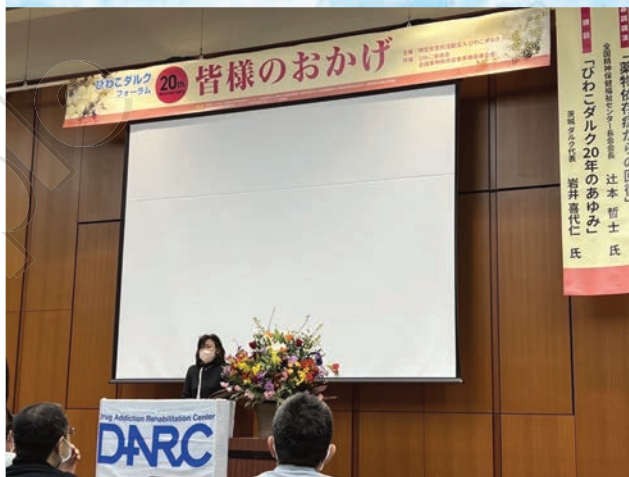
サントゥアリオ職員 タク

1度失敗し再挑戦してから今年でクリーン7年になるのですが、再挑戦のスタート地点が琵琶湖ダルクからでした。この様な形で再び滋賀に行かせて頂けるとは当時は思ってもいませんでした。自分が地元でどうしようもない時に遠い中ワザワザ足を運んで沖縄に戻る様に説得して頂いた当時の琵琶湖ダルクの職員の方や久しぶりの仲間との再会もありとても充実した2日間でした。