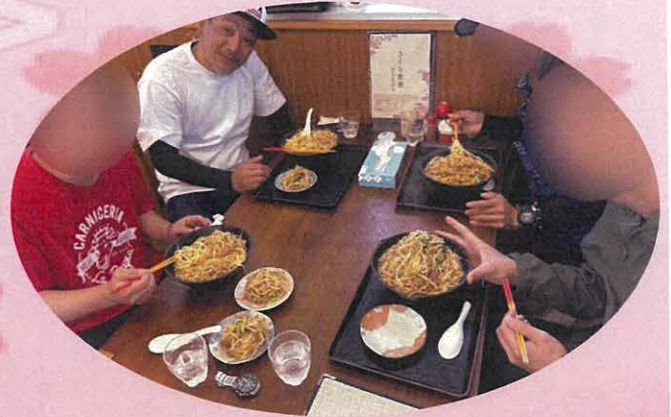
会社の店舗のキャッチアップ