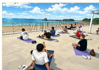
サンライズミーティング