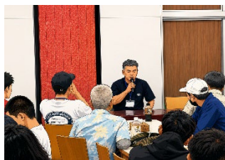
スピーカーミーティング

楽しいひとときの陰で、何度も集まり準備を重ねてくださったコミティ（運営チーム）の皆さんのご尽力に、心からの感謝をお伝えします。本当にありがとうございました。