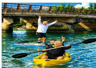
カヤック・サップ体験